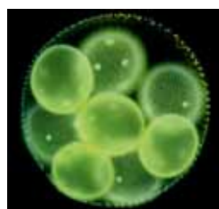
Groenwieren - Chlorophyta