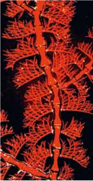
▲ Pterothamnion plumula

roodwieren niet voor. De voortplanting van de sporofyt is vaak door middel van tetrasporen, die onder reductiedeling gevormd worden. Ongeslachtelijke vermeerdering komt in diverse groepen roodwieren voor. Bij het onderscheiden van soorten is het een grote uitdaging de verschillende generaties van één levenscyclus bij elkaar te ordenen.