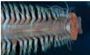
Ringwormen - Annelida