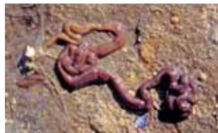
Snoerwormen - Nemertea