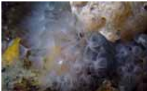
Hoefijzerwormen - Phoronida