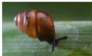
Weekdieren - Mollusca