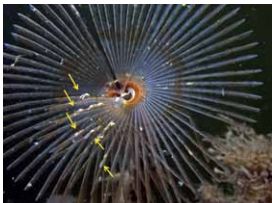
▲ Acartia tonsa