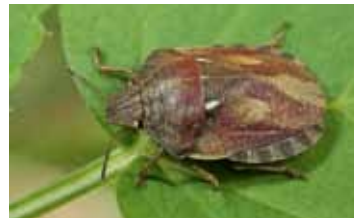
Schildwantsen - Scutelleridae