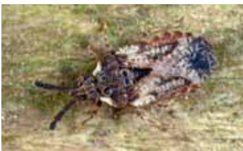
Schorswantsen - Aradidae