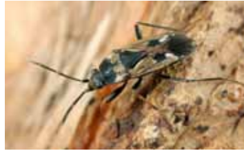
Bodemwantsen - Lygaeidae