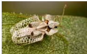
Netwantsen - Tingidae