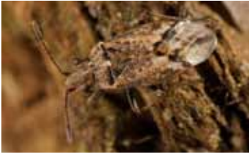
Bodemwantsen - Lygaeidae