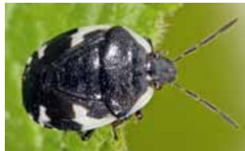
Aardwantsen - Cydnidae