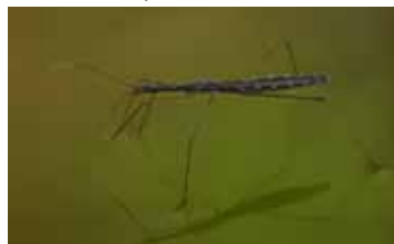
Vijverlopers - Hydrometridae