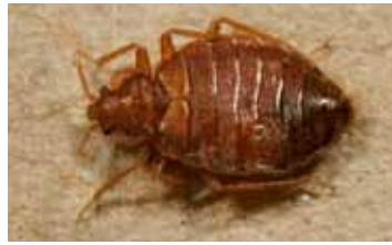
Bedwantsen - Cimicidae