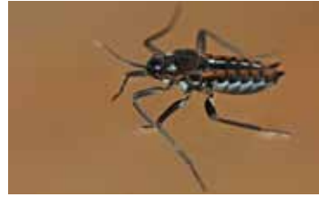
Beeklopers - Veliidae