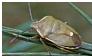
Boomwantsen - Pentatomidae