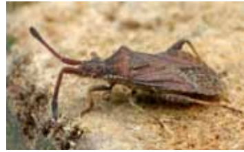
Randwantsen - Coreidae