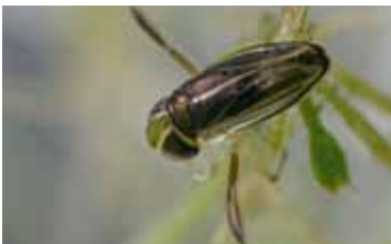
Duikerwantsen - Corixidae