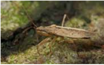
Sikkelwantsen - Nabidae