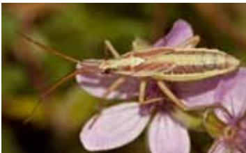
Weekwantsen - Miridae