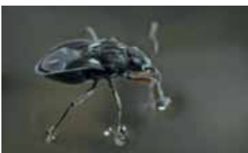
Moslopertjes - Hebridae