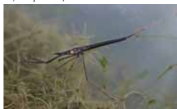
Waterschorpioenen en staafwantsen - Nepidae