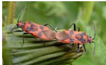
Glasvleugelwantsen - Rhopalidae