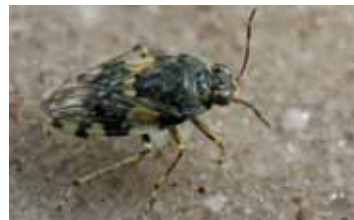
Oeverwantsen - Saldidae