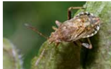
Glasvleugelwantsen - Rhopalidae