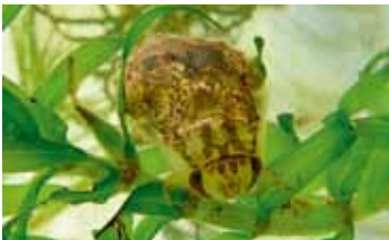
Platte zwemwantsen - Naucoridae