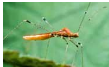
Stelwantsen - Berytidae