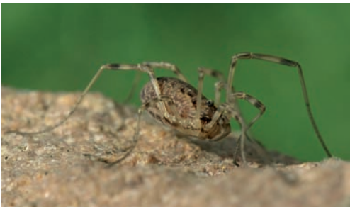
Fig. 12. Oligolophus tridens .