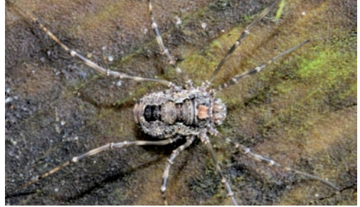
Fig. 11. Platybunus pinetorum .