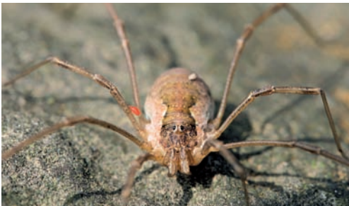
Fig. 14. Mitopus morio .