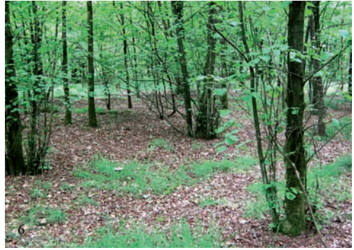
Figuur 3-6. Voorbeelden van bemonsterde bostypes: 3. berk Betula , 4. zomereik Quercus robur en winter-eik Q. petraea , 5. Amerikaanse eik Q. rubra , 6. hazelaar Corylus avellana . Voor beuk en linde zie figuur 1-2.