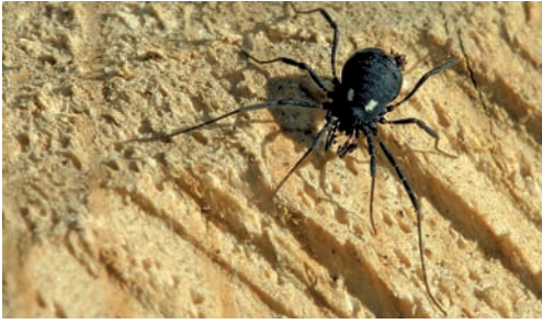
Fig. 8. Nemastoma lugubre .