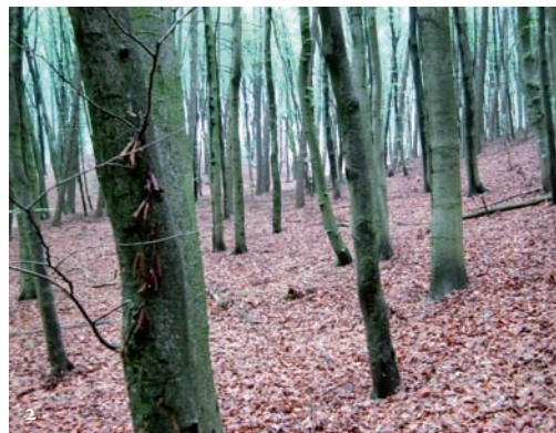
Figuur 1-2. Bossen verschillen enorm van elkaar in bodemstructuur en ondergroei, 1. lindebos ( Tilia ), 2. beukenbos ( Fagus ). Zie ook figuur 3-6.

Figure 1-2. Forests differ significantly in soil structure and understory plant growth, 1. lime forest ( Tilia ), 2. beech forest ( Fagus ). See also figure 3-6.