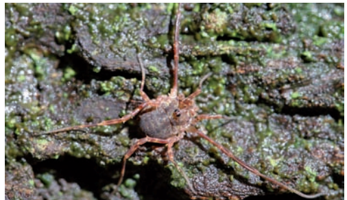
Fig. 13. Lophopilio palpinalis .