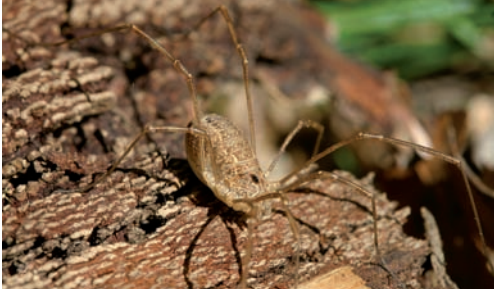
Fig. 10. Rilaena triangularis .