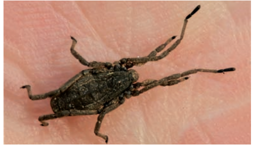
Fig. 9. Trogulus tricarinatus .