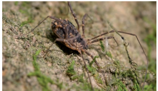
Fig. 15. Astrobunus laevipes .