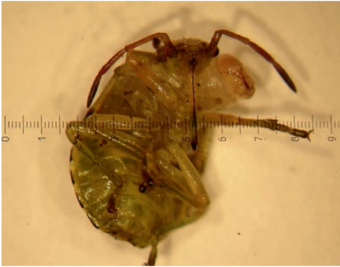
Figuur 1. Holopyga generosa larve komt uit een nimf van Palomena prasina . Foto René Veenendaal.

Figure 1. Holopyga generosa larva crawled out of Palomena prasina nymph. Photo René Veenendaal.