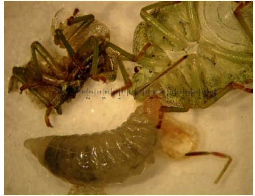
Figuur 2. Holopyga generosa larve eet aan haar tweede wants.

Figure 1. Holopyga generosa larva crawled out of Palomena prasina nymph.